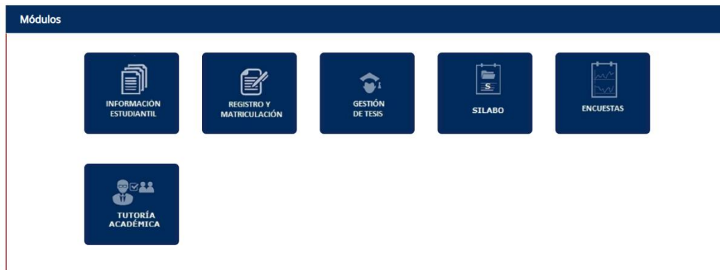
Figura 2. Módulos del SAEw

Haz clic sobre INFORMACIÓN ESTUDIANTIL , y verás una pantalla similar a la de la Figura 3.