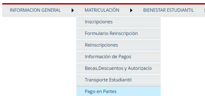
Figura 4. Menú Matriculación