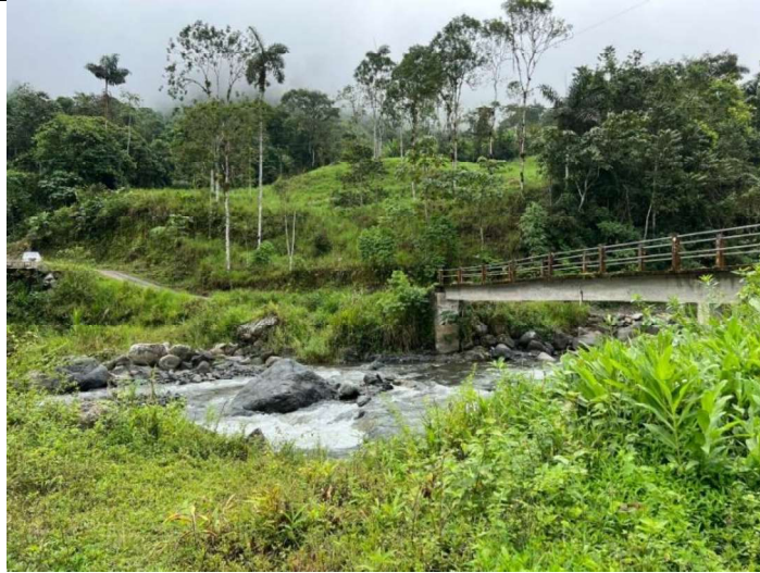
Sitio de Implantación de Captación - Localizado cerca de puente – Rio Gala