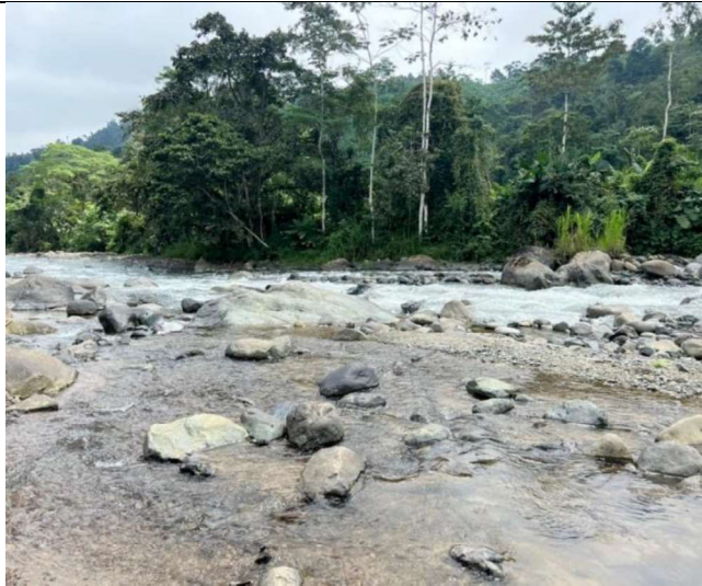
Sitio de Implantación 2 de Casa de Máquinas Captación - Localizado 10 m dentro de la calle principal de segundo orden

Otras tareas realizadas para la EPN durante la comisión de servicios: