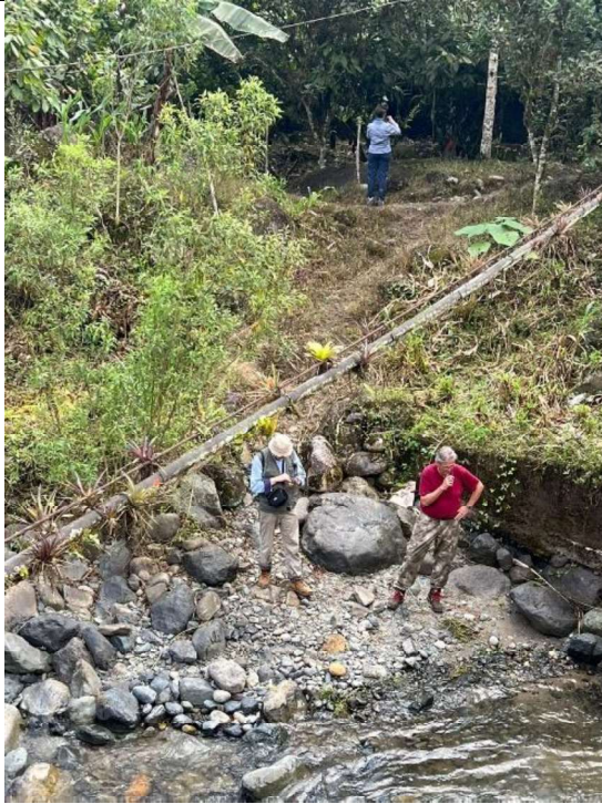
Sitio de Implantación 1 de Casa de Máquinas Captación - Localizado cerca de puente 2